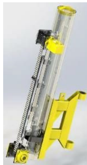
Battage SPT automatique