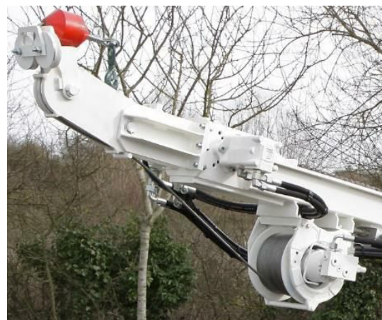
Treuil et rallonge de mât